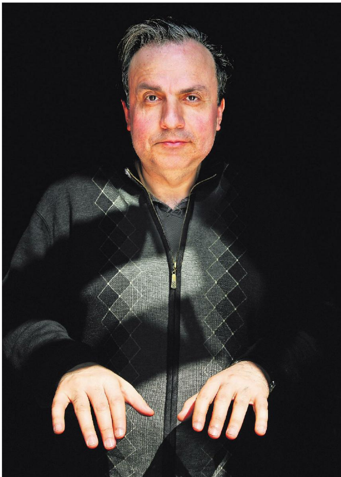
Klaviervirtuose Bronfman, 51: «Wenn ich während zweier Wochen keinen Auftritt habe, werde ich nervös. Ich brauche den Auftrittsstress»