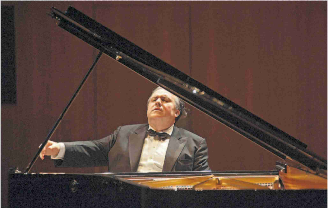
Brillante Klavierkunst ohne Sentimentalität: der amerikanische Pianist Yefim Bronfman (53) im Konzertsaal.