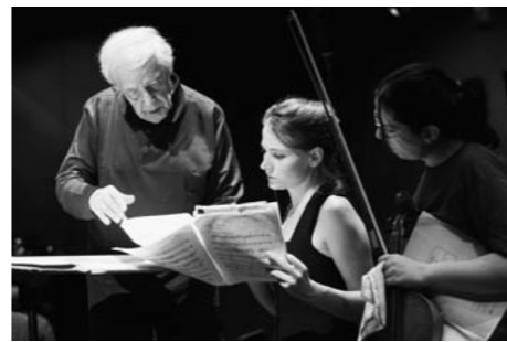
Pierre Boulez mit Mitgliedern der LFA