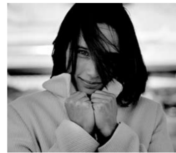
Hélène Grimaud