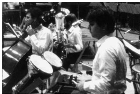
El pueblo nunca muere

Zum ›(z)eidgenössisch‹-Schwerpunkt steht ein weiterer Schweizer Komponist in zwei Filmen im Zentrum. Mit der eindrücklichen filmischen Version der Komposition ›Erniedrigt – geknechtet – verlassen – verachtet‹ ist Mathias Knauer eine nachhaltige Vergegenwärtigung eines der bedeutendsten Werke von Klaus Huber gelungen, dessen politisch-humanitäre Botschaft heute nicht weniger aktuell und aufrüttelnd ist als im Jahr 1983. Dazu gibt es ein im letzten Jahr entstandenes